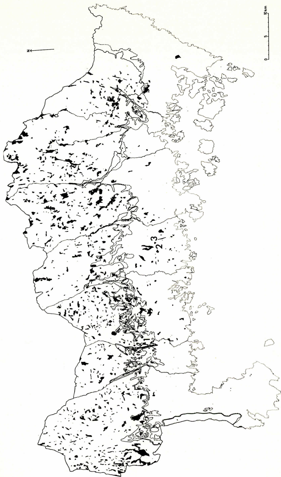
Fig. 1. Karta visande fördelningen av Blekinges sjöar i förhållande till den ungefärliga sträckningen av högsta kustlinjen (belägen på ca 50—60 m ö.h.). Streckad linje=isohypsen för 50 m ö.h.; heldragen linje=isohypsen för 60 m ö.h. 1 Stora Kroksjön, 2 Blanksjön, 3 Gattsjön.