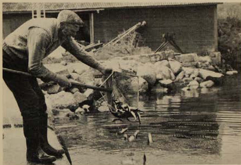
Utsättning av laxsmolt i Vättern