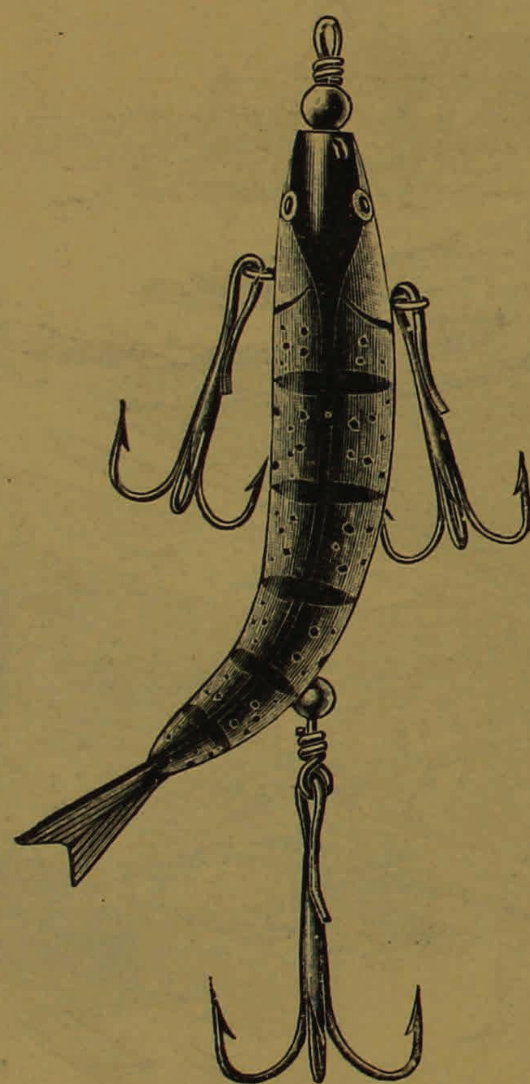
N:r 7249 •TIT-BIT• (medelstorlek).

Under åren 1900—1910 har fabriken erhållit 6 "Grand Prix", hvilket bekräftar den öfverlägsna kvaliteten af de varor, som fabriken tillverkar.