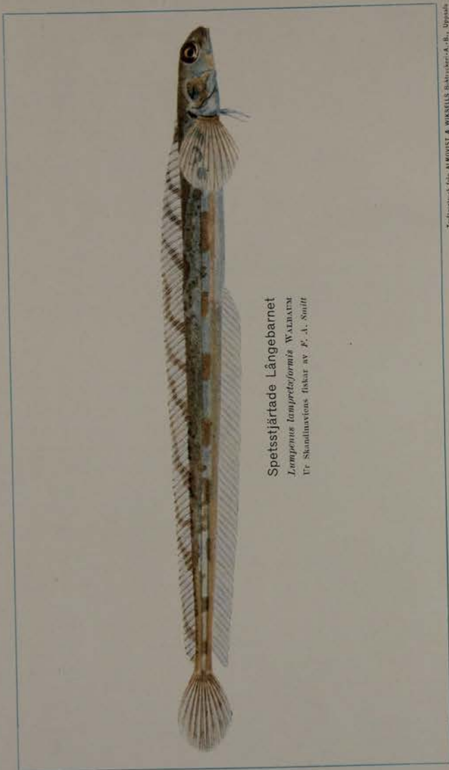
Spetsstjärtade Långebarnet Lumpenus lampretiformis WALBAUM Fr. Skandlaxens fiskar av F. A. Smit

Tidningstryck hos ALMQVIST & WIKSELLS Boktryckeri, A.-B., Uppsala.