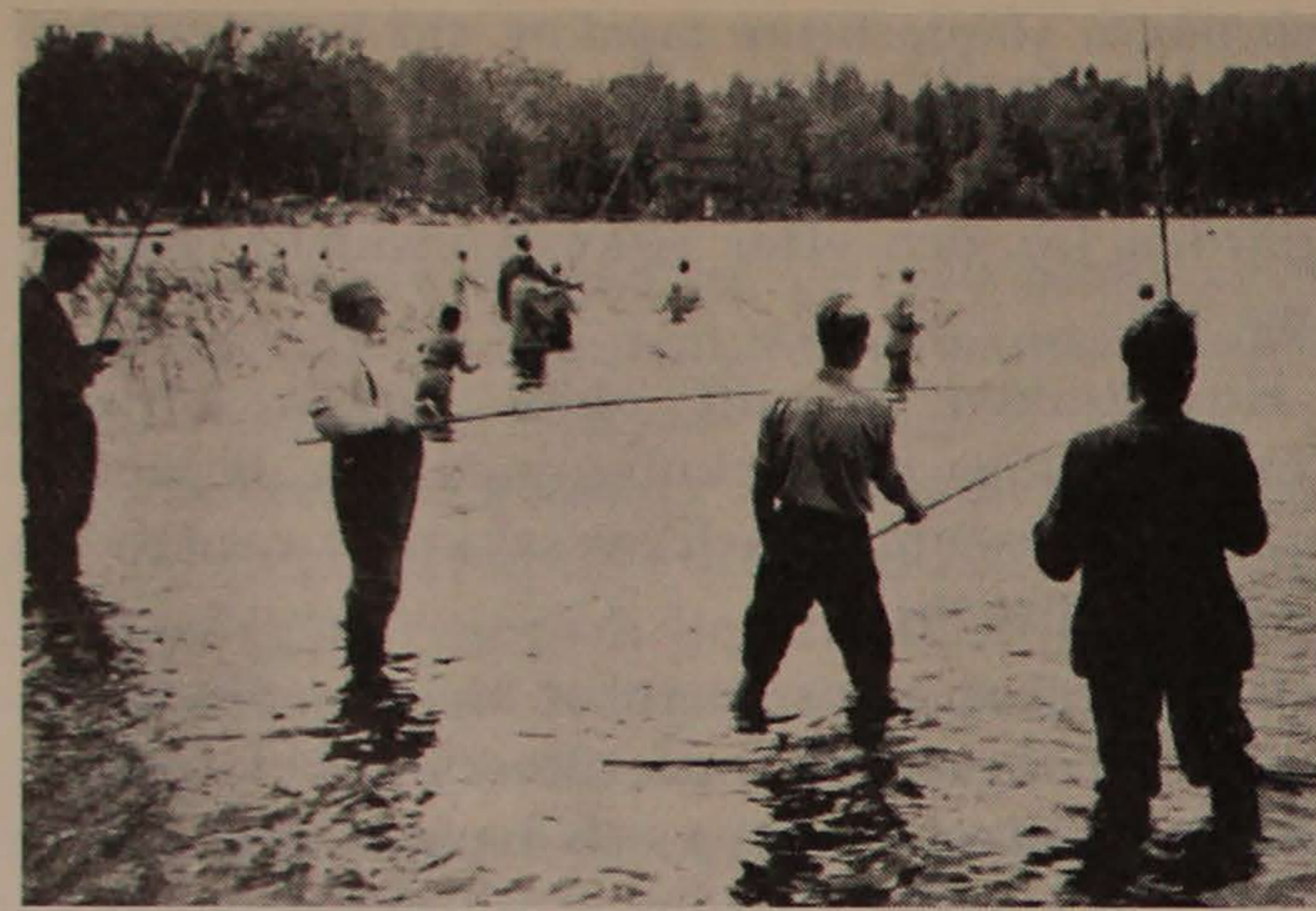
Några av de 264 deltagarna i metnings-tävlingen vid Kärrasand.