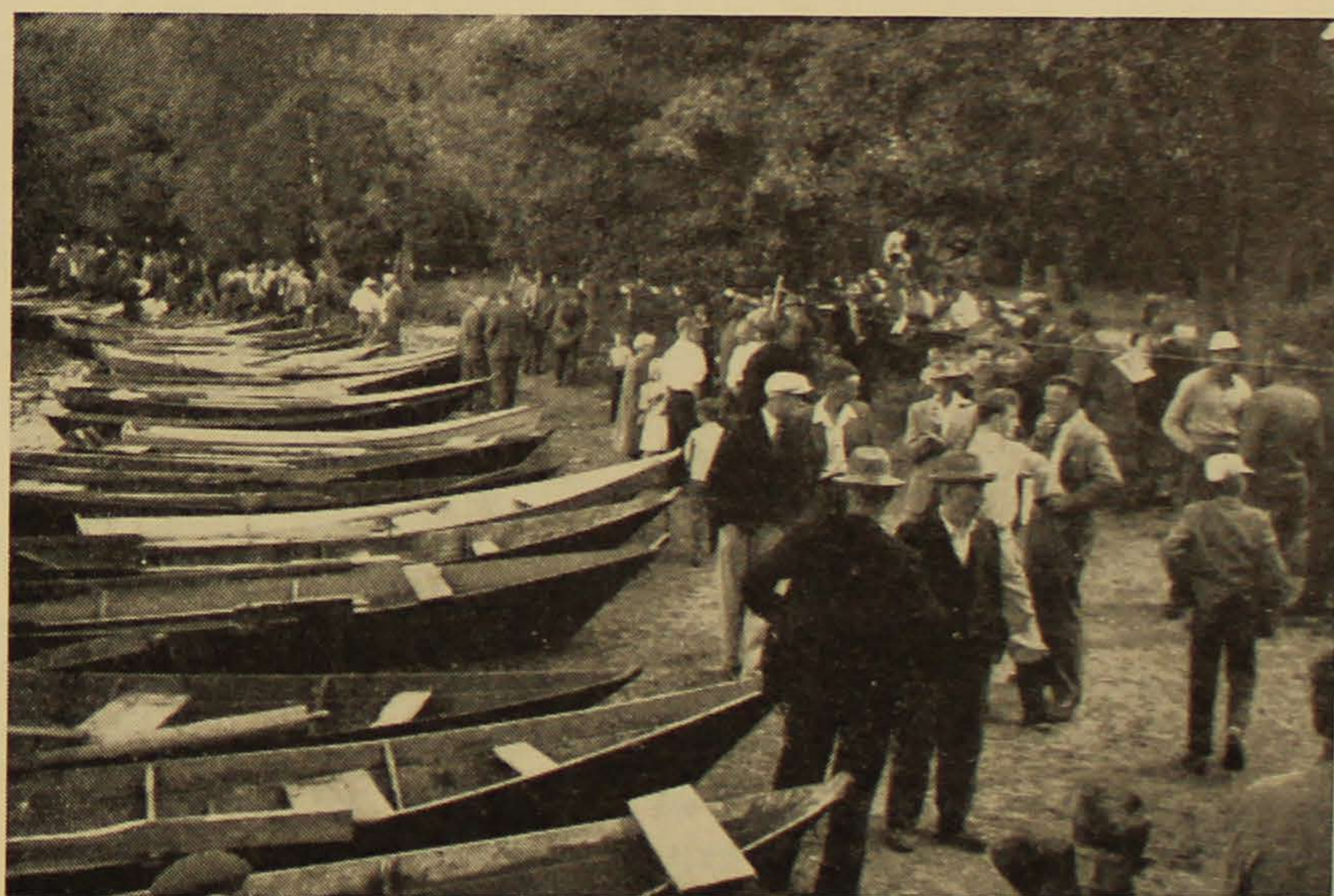
Från Åsnens fiskefest 1959. Några av de 80 båtarna.